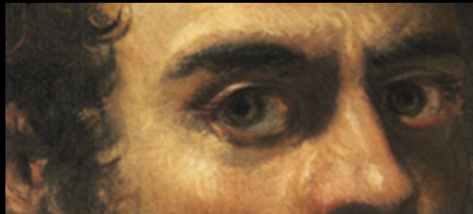
A MESS. JACOPO ROBUSTI DETTO IL TINTORETTO