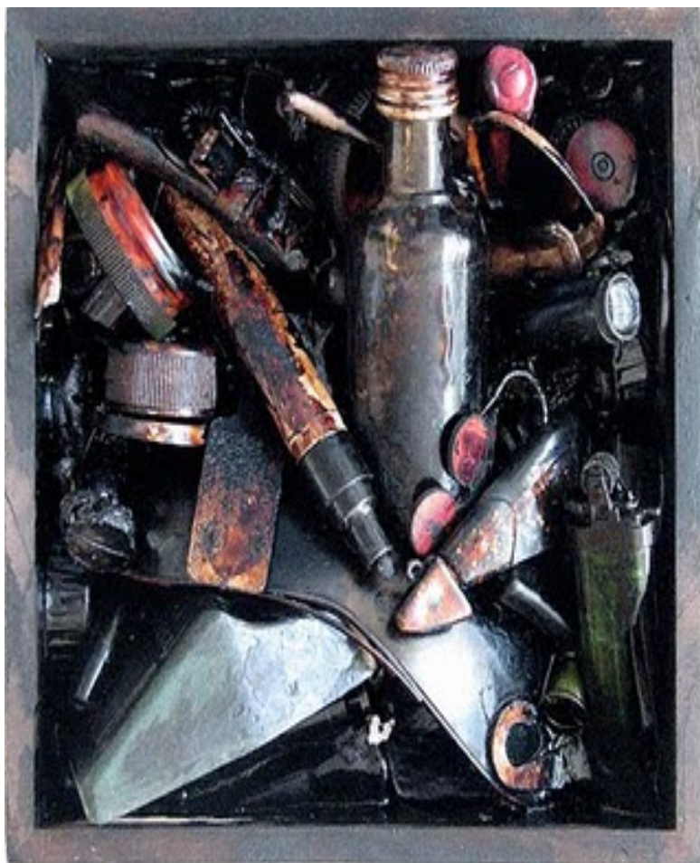
Art Assemblage, Gift from the Sea

Τετάρτη 20 Ιουλίου 2011 Απογευματινή Συνεδρία