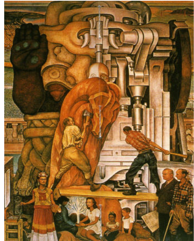
Diego Rivera, Pan-American Unity , 1940, City College of San Francisco

Αλλοδαποί και συντοπίτες, εργατικά σωματεία και πρόσφυγες: στρατηγικές ελέγχου της αγοράς εργασίας στην Αθήνα και τον Πειραιά 1890-1922.