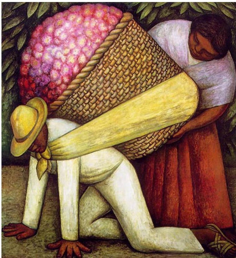
Diego Rivera, The Flower Carrier , 1935, Museum of Modern Art, San Francisco, USA

16 η Θερινή Συνάντηση Μεταπτυχιακών Φοιτητών Νεότερης και Σύγχρονης Ιστορίας Ρέθυμνο, 18-20 Ιουλίου 2011 Αίθουσα 3 της Φιλοσοφικής Σχολής