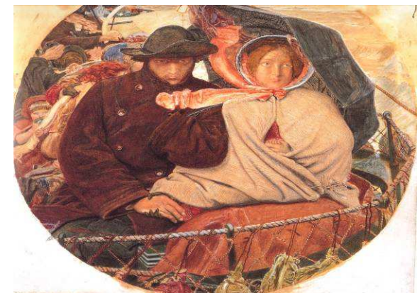
Ford Madox Brown, The Last of England , 1864-66, Tate Britain

Οι διασπάσεις της Εταιρείας Ελλήνων λογοτεχνών στη διάρκεια του εμφυλίου πολέμου