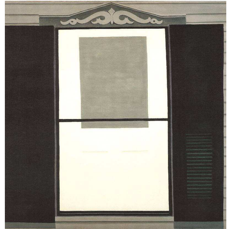
Georgia O'Keefe, Lake George Window , 1926, Museum of Modern Art, New York

13 η Θερινή Συνάντηση Μεταπτυχιακών Φοιτητών Νεότερης και Σύγχρονης Ιστορίας Ρέθυμνο, 16-18 Ιουλίου 2008