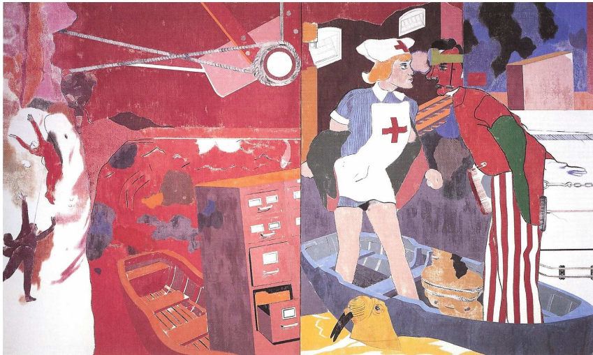
Ronald B. Kitaj, Erie Shore , 1966, Neue Nationalgalerie Berlin

«Κυρίες και δεσποινίδες, φίλες του "μεγάλου κουνελιού"». Οι Ελληνίδες αναγνώστριες του Playboy (1985-1990)».