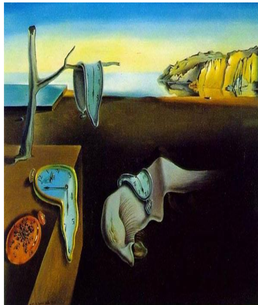
Salvador Dalí, The Persistence of Memory (1931), Μουσείο Σύγχρονης Τέχνης, Ν. Υόρκη

Μανουσάκης Βασίλης, Αριστοτέλειο Πανεπιστήμιο Η οικονομία της κατεχόμενης Ελλάδας και οι κατακτητές.