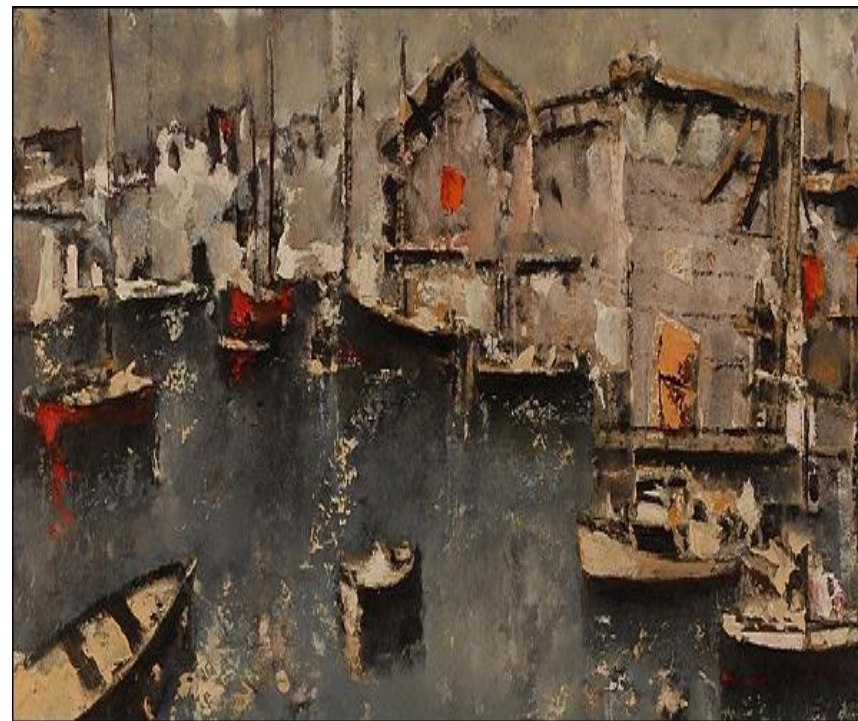
Γιάννης Σπυρόπουλος, Το λιμάνι της Βενετίας (Μύκονος)

Οι εργοστασιακές απεργίες στην Πάτρα της πρώιμης Μεταπολίτευσης. Μια πρώτη απόπειρα ανάλυσης.