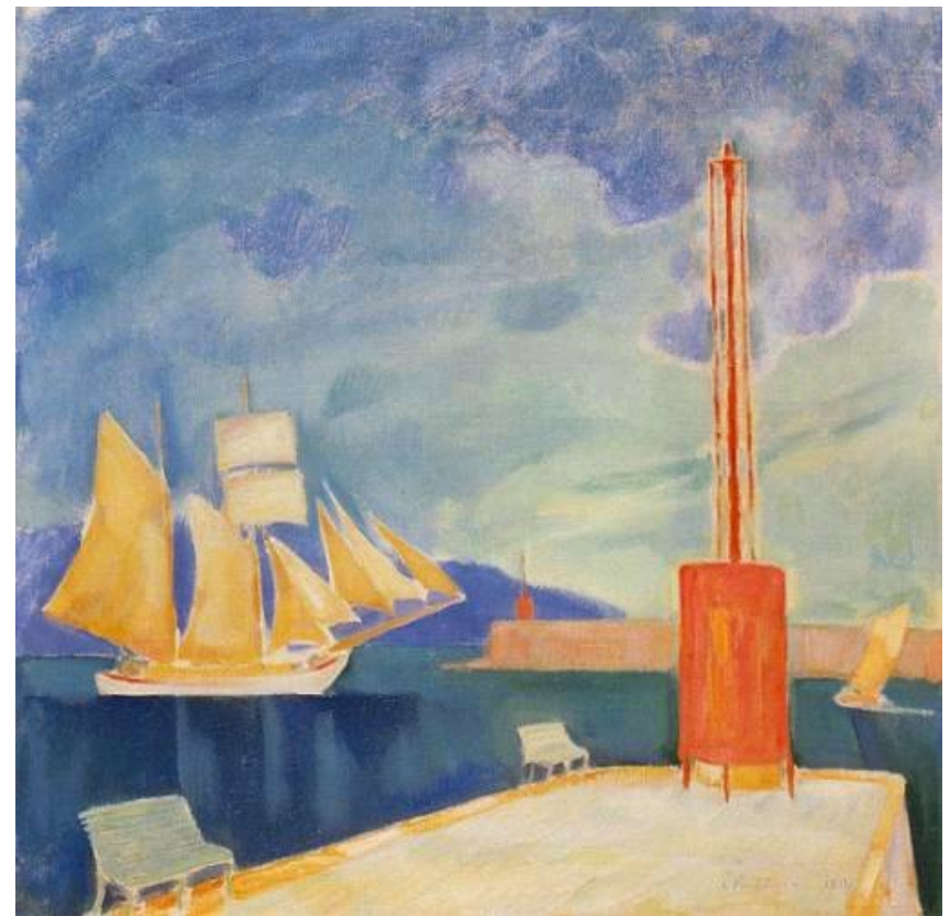
Κωνσταντίνος Παρθένης, Το λιμάνι της Καλαμάτας , 1911, λάδι σε καμβά, συλλογή ΕΠΜΑΣ