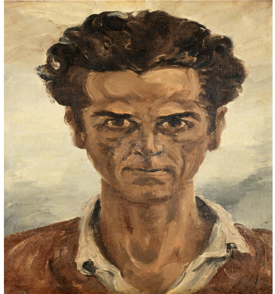
Δημήτρης Κατσκογιάννης, Προσωπογραφία άνδρα , λάδι σε μουσαμά, Μουσείο Γ. Ι. Κατσίγρα, Λάρισσα

Ελληνικές συμμετοχές στην Παρισινή Κομμούνα.