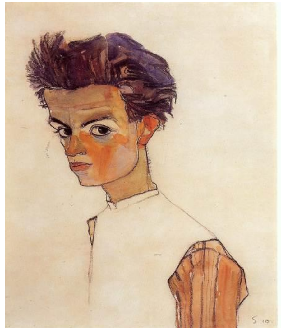
Egon Schiele, selfportrait, 1910, Leopold Museum, Vienna

Νίκος Λεωνιδάκης, Πανεπιστήμιο Κρήτης Πέρα από τον φορντισμό: Θεάσεις της μεταβιομηχανικής- μεταφορντικής κοινωνίας κατά τις δεκαετίες 1970-1980.