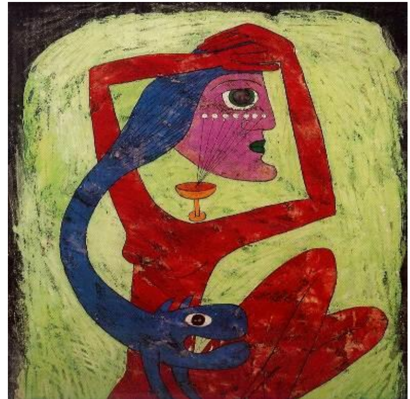
Victor Brauner, Strigoï, La Somnambule, 1946, Musée d' Art Moderne, Strasbourg