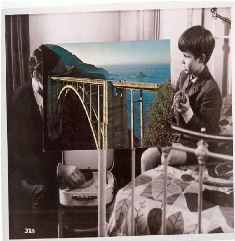
John Stezaker, Bridge (B) I, 2007