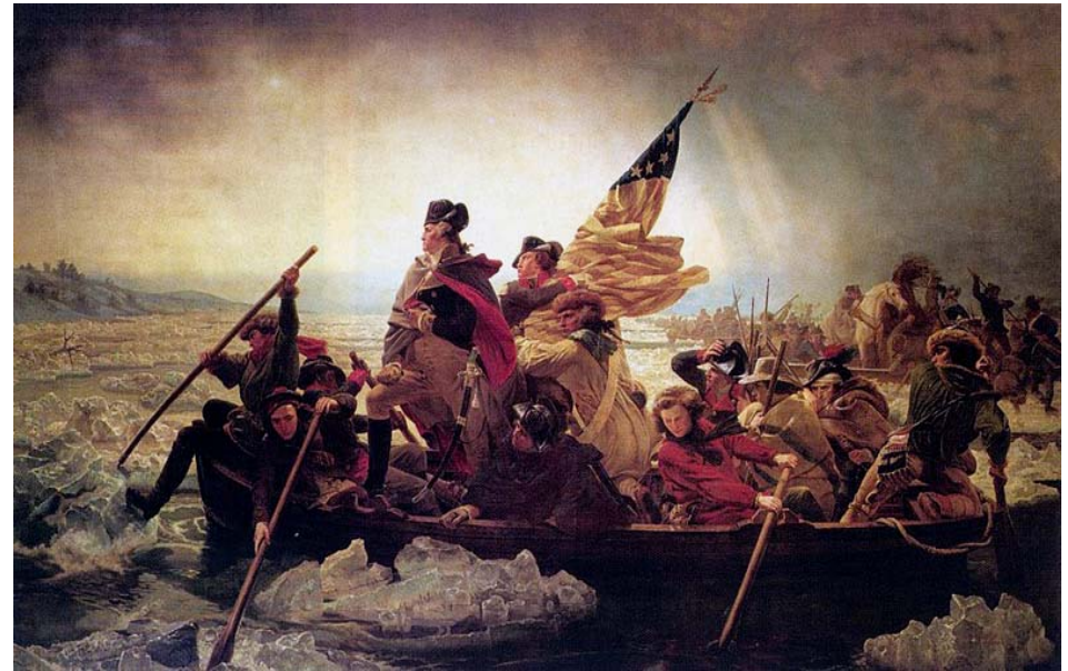
Emanuel Leutze, Washington Crossing the Delaware, 1851, Metropolitan Museum of Art, New York