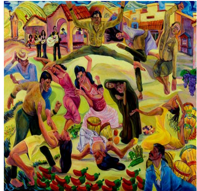
Allen Schmertzler, The Question of Immigration, 2009

14 η Θερινή Συνάντηση Μεταπτυχιακών Φοιτητών Νεότερης και Σύγχρονης Ιστορίας Ρέθυμνο, 17-19 Ιουλίου 2009