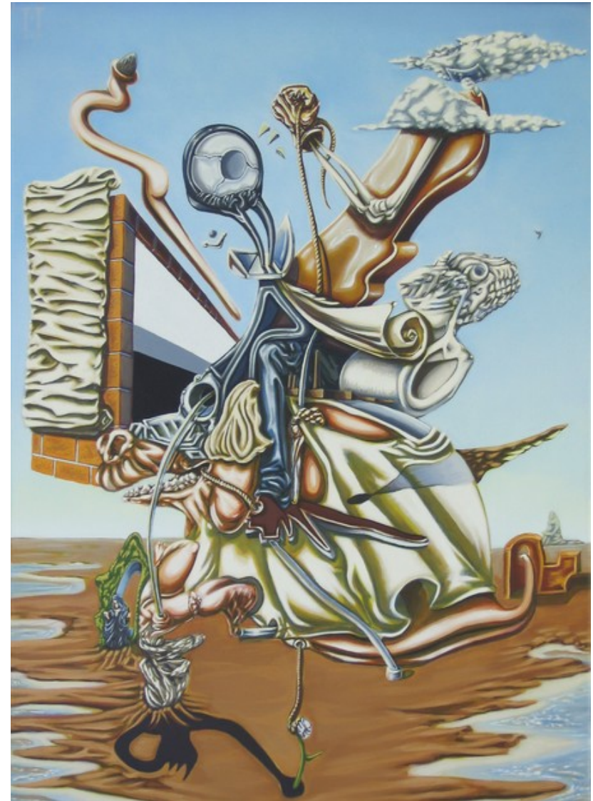
Bill McAllister, Due to rapid advances in modern technology, a tiny mass-produced, and highly imported child's toy spontaneously evolves into all of western civilization, and thereupon relocates itself into in search of new lands with future potential for economic growth , 2006.

«Το Δόγμα Τρούμαν και το Σχέδιο Μάρσαλ. Η ιστορία της αμερικανικής βοήθειας στην Ελλάδα». Μερικές ιστοριογραφικές παρατηρήσεις