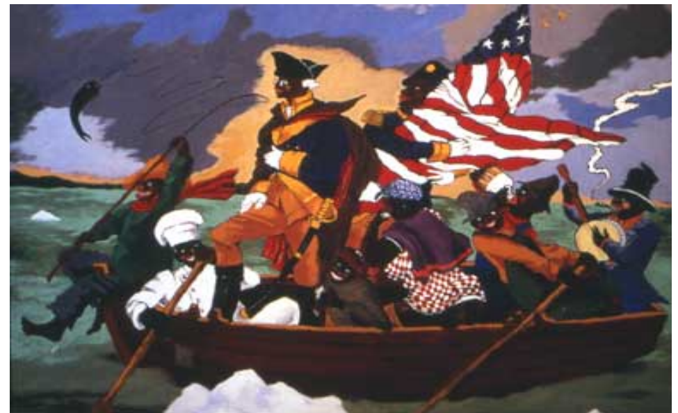
Robert Colescott, George Washington Carver Crossing the Delaware: Page from an American History Textbook, 1975